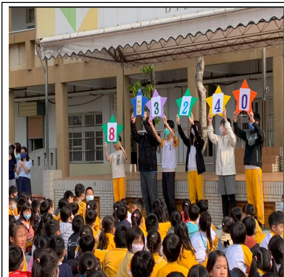
全校朝會宣導鼓勵增加戶外運動時間