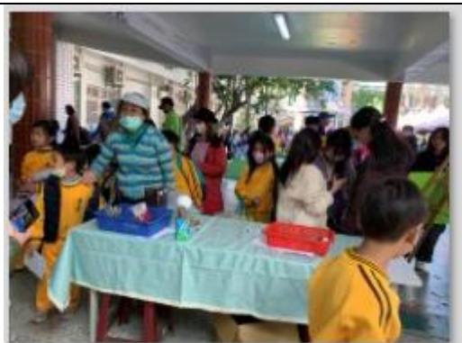
視力保健闖關第三關