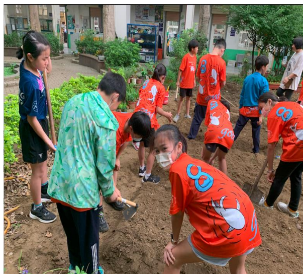
親近綠水農園，栽植植物