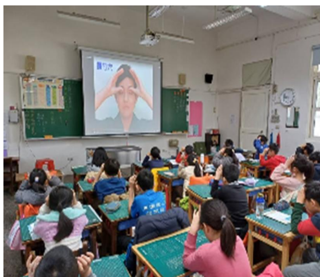
視力保健-健康課程融入課程