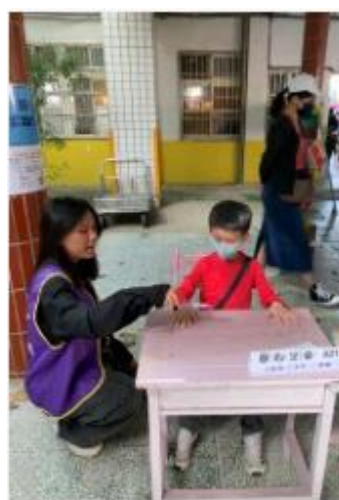
視力保健闖關第二關