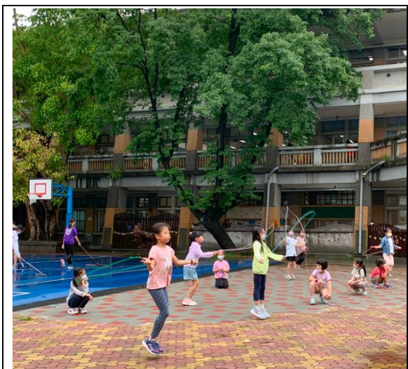
晨間戶外運動推廣跳繩 1