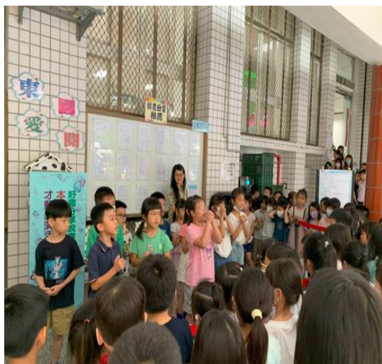
鼓勵下課淨空戶外朗讀活動