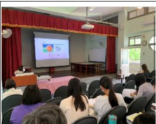
視力保健宣導講座