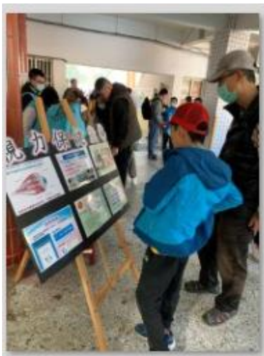
視力保健闖關第一關